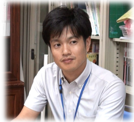
校内研究主任の先生

研究会の、グループでの協議は盛り上がり、それぞれのグループで活発に意見を出し合っているなと思います。しかし、グループ毎で協議したことをみんなつないで、最後に校内研究として、V小学校として一定の方向性を示してまとめるというところまでいくのがなかなか難しいなと感じています。研究授業を見てみんなが感じたことを出し合い、どのような意見が出るのかということはこちらがある程度想像することができても、授業の中で子どもの反応を予想することとは違い、予めまとめを用意することもできないので、まとめることまでできればよいなと思っています。もちろん最終的には個人の課題に対してどうしていくかということだと思うのですが、研究協議の成果をまとめることができれば、アップデートシートを書く時にも自分の課題に即して、視点を絞って書くことができるだろうと思います。そうすればより実りのある校内研究会になっていくのだろうと思います。