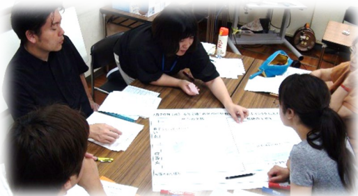
「1」グループの協議の様子