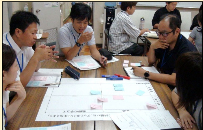
「2」グループの協議の様子

児童cを、1時間を通して観察していました。児童cが児童dと交流していた時のことを話します。児童dは授業中によく発言をする児童で学力が高い児童なのですが、二人の交流は「グッとポイント」を説明するだけのものでした。叙述を基に交流をしているが、自分の考えの根拠とは言えない。読んで分かることを相手に伝えているだけでした。その交流で学びを深めるのは難しいと思います。「グッとポイント」を相手に伝えているので、自分が感動した理由を話せるとよかったなと思いました。