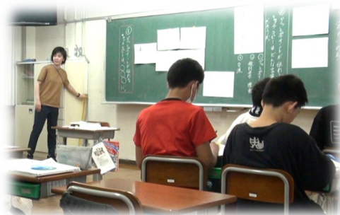
A先生の授業の様子

今回は、研究授業と事後研究会を参観させていただきだけでなく、事前・事後インタビューも実施させていただきV小学校の先生方には大変お世話になりました。先生方の「学び」に対する熱意や子どもたちへの思いに直に触れることで、校内研究を活性化させることの意義を改めて感じる事ができました。