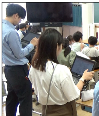
Chromebookを使って指導案への書き込みを即時で共有

授業者であるA先生の課題は「学級内の学力の差が大きく、児童一人ひとりの学びにつながる授業づくり、学級全員が参加できる授業づくりに難しさを感じている」ことです。その課題を解決するために、A先生は様々な手立てを講じておられました(表)。