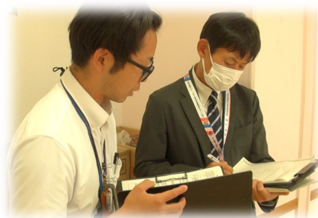
ターゲット教員へのインタビュー

今回、学びを見取っていただいた経験を各実践校の先生方の学びの見取りに生かしていただき、今以上に教員一人ひとりの学びの転換を推進する校内研究のあり方を考えていただけることを期待しています。