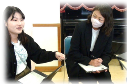
教員の学びを見取る

参観終了後に研究委員のみなさんには、グループ協議中に見取ったターゲット教員の学びを整理したり、ターゲット教員の今後の学びにつながる情報を収集したりするためにインタビューを実施していただきました。