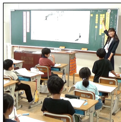
3年4組の授業の様子

また、校内研究主任は、かねてより「校内研究で協議の時間を十分に確保することが難しい」と仰っていました。その課題を解決するために今日の授業参観では、同じ研究グループに所属されている先生方がChromebookを使って指導案への書き込みをその場で共有することで、研究協議における情報共有の時間を短縮することに挑戦されました。