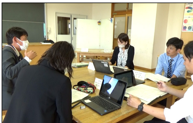
研究委員同士の協議の様子

それぞれが異なる課題を設定して参観した授業を基に話されていたのですが、子どもの学びの姿から協議が繰り広げられることにより、一人ひとりの課題につながる新たな気づきを得られる場面がたくさん見られました。