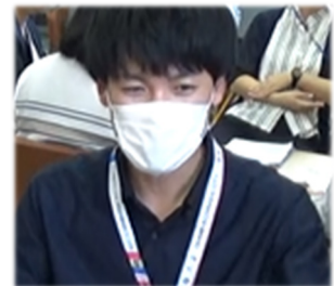
A先生(外国語科担当)

生徒指導提要に掲げられている生徒指導の四つの視点のうちの一つ「安全・安心な風土の醸成」を研究の柱とするグループに所属することにしました。そして、「安心して自分の考え・思いを発信できる授業」を目指し、外国語科の授業の中で、「学習したことを、生きた英語として会話に使う。スピーキングの機会をもっと取り入れる」ことを意識して授業改善に取り組むことにしました(図1)。