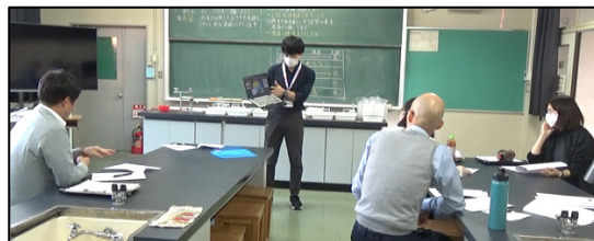
指導内容の説明をするA先生

A先生は、今回の研究授業で<疑問詞+to>の文法を使って、「ユニバーサル・デザインのことを英語で紹介してみよう」と自身が興味のあるものを英語で紹介する授業を計画しています。その際、「安心して学習できる環境づくり」にも力を入れて、所属する「安心・安全な風土の醸成」というグループの目標の達成を目指しています。しかし、「安心して学習できる支援」は、日常的な取組として行っているものの、研究授業の支援として、その場で成果が見取れるように指導案に盛り込むことに難しさを感じていました。検討会では、「言語活動の充実」と「安心して学習できる支援のあり方」を中心に協議が進められました。