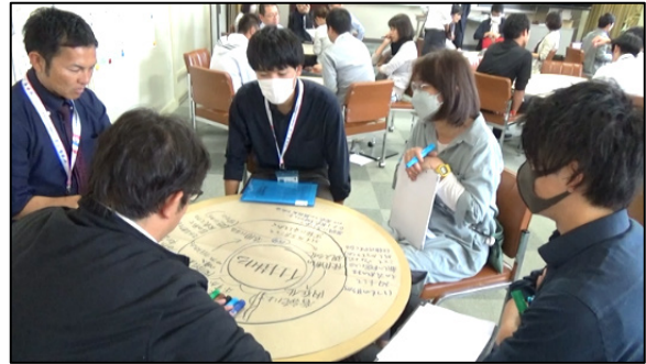
図3 「えんたくん」を使った交流の様子

ワールドカフェ形式で、「2. 授業の振り返り(グループ協議)」の様子が交流されました。メンバーを2度入れ替えて振り返りの内容を交流した後、元のグループに戻って学んだことを共有するという流れで行われました(図3)。