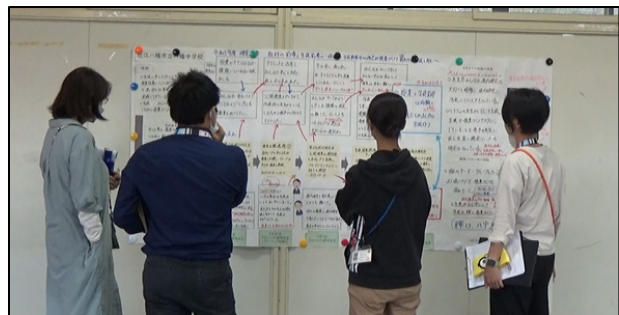
図4 校内研究省察ポスターを見て話す先生方の様子

全体会の後、校内研究省察ポスターを見ながら話す4人の先生の姿を見つけました。一人の先生が、『個別最適な学び』をいかに充実させるかが難しい』と言い、他の3人の先生とやりとりをされていました(図4)。校内研究省察ポスターも、校内研究全体会も同じですが、校内研究主任の取組がきっかけとなって先生方の学びが広がっていくのは、とても素敵なことだと感じます。