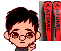
研究員 島内 佑祥