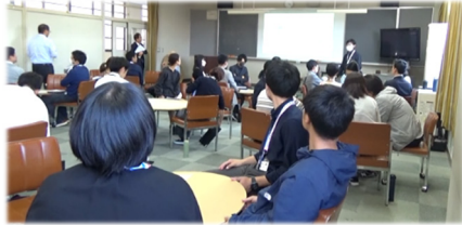
校内研究全体会の様子